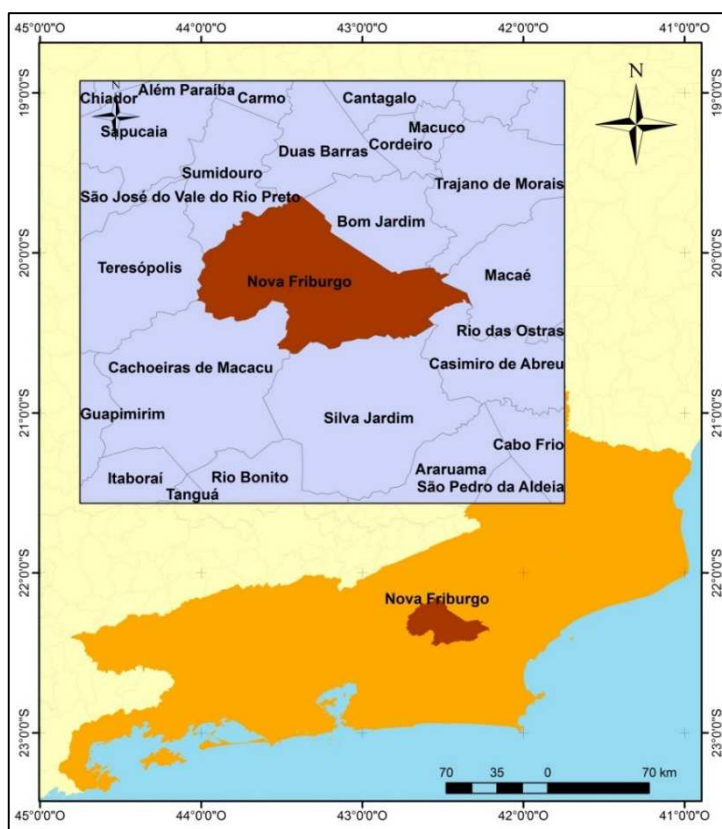
Figura 1: Localização do Município de Nova Friburgo

O município de Nova Friburgo é banhado pelas bacias do Rio Grande, Rio Bengalas, dos Ribeirões de São José e do Capitão e do Rio Macaé. Os principais rios que cortam o centro da cidade são o Rio Santo Antônio, Rio Cônego e o Rio Bengalas, que se forma após o encontro destes rios.